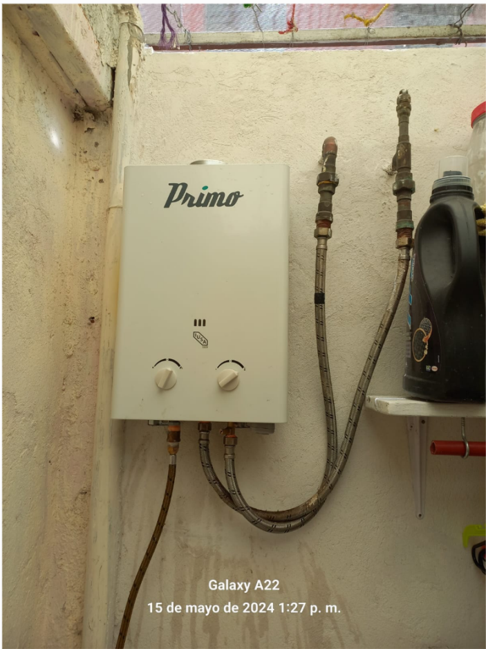
Galaxy A22 15 de mayo de 2024 1:27 p. m.