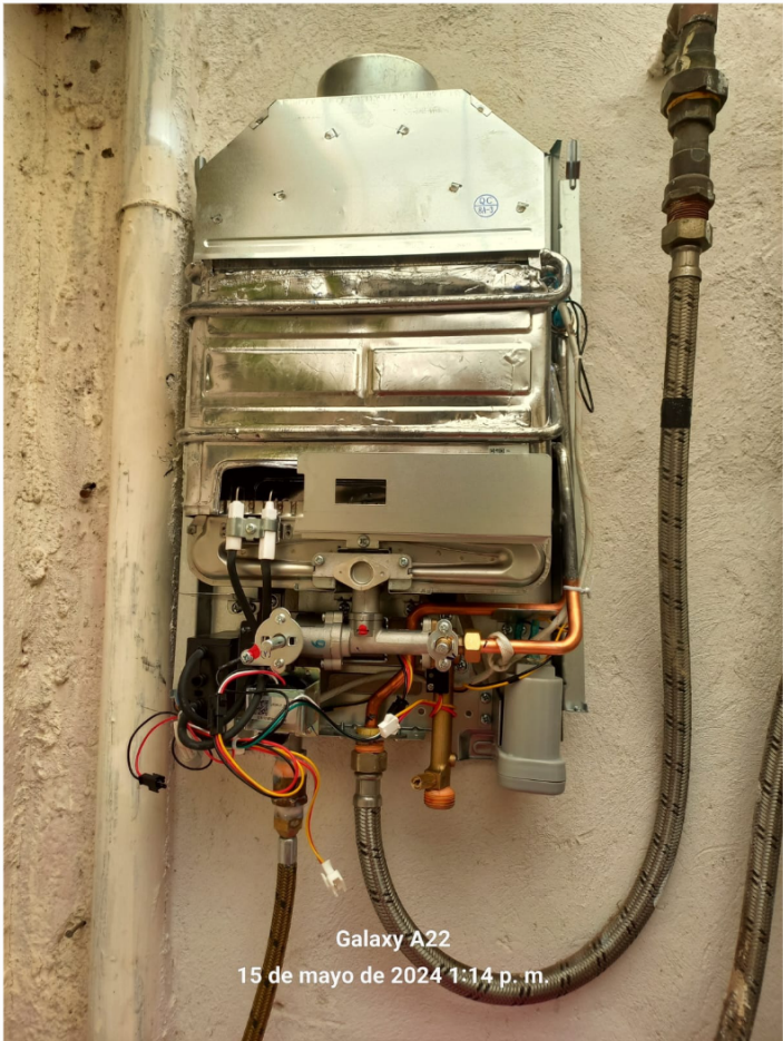
Galaxy A22 15 de mayo de 2024 1:14 p. m.